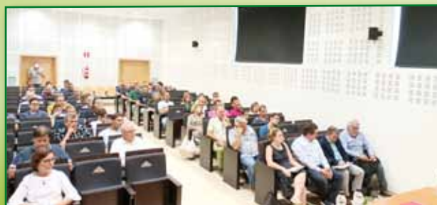
Femoga Jornada se Porcino en Sariñena