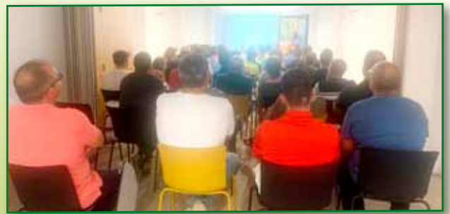
Jornada PAC 20 septiembre Barbastro Tarde