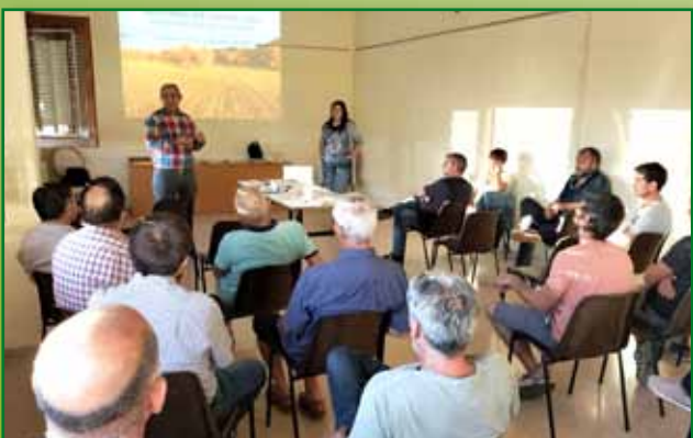
Jornada de PAC 22 Septiembre Castillonroy