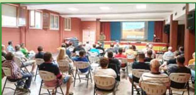
Jornada PAC 13 septiembre Ontiñena