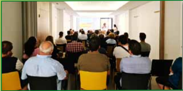
Jornada PAC Charla Pac Barbastro