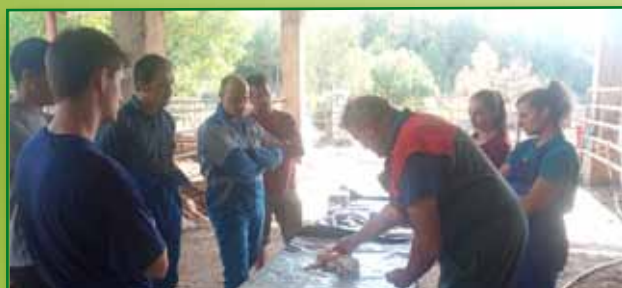
Curso Inseminación Vaca Nodriz Ainsa Septiembre