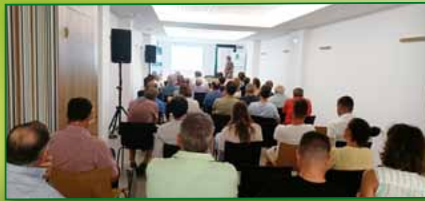
Jornada de almendro ecologico en Babastro