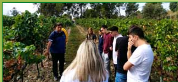
Curso incorporación Septiembre-Octubre Babastro