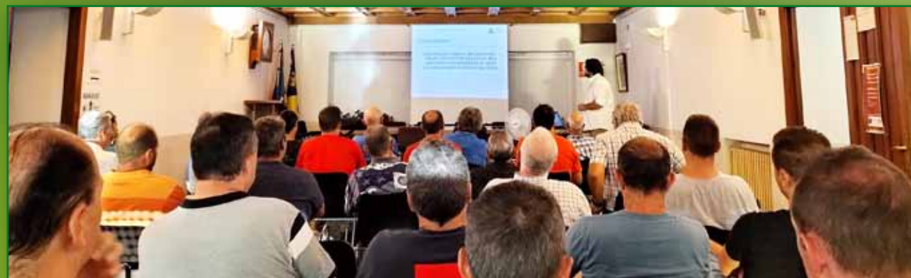
Jornada de PAC 30 agosto Ayerbe