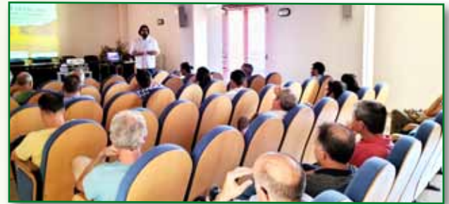
Jornada PAC 6 septiembre Ayerbe