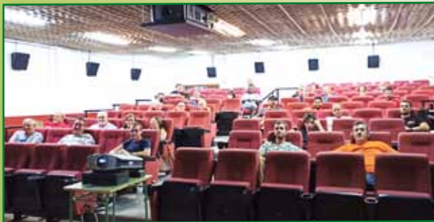
Jornada PAC 23 de agosto Tamarite de Litera