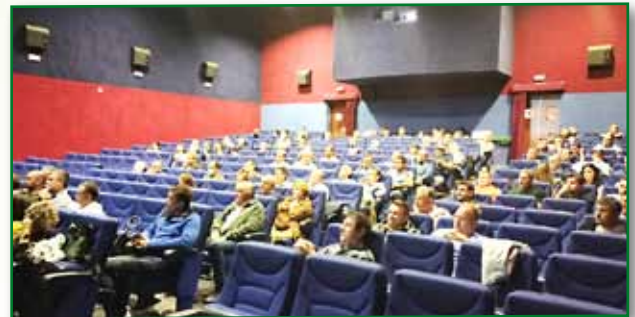
Jornada PAC 27 septiembre Sariñena