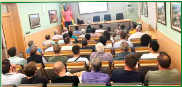
Jornada PAC 8 septiembre Huesca