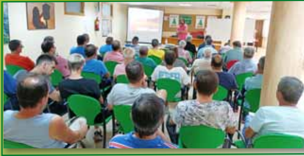
Jornada PAC 1 septiembre Fraga