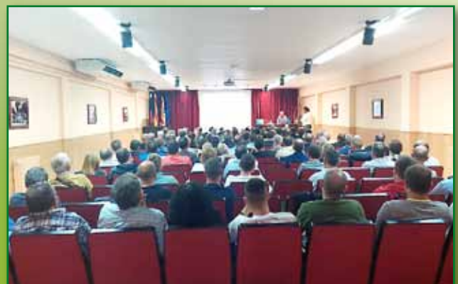
Jornada de PAC 29 septiembre Monzon