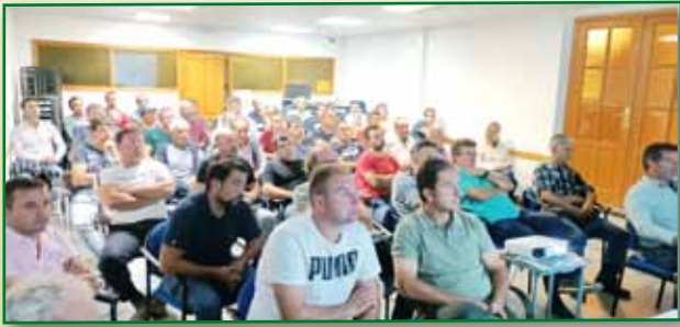
Jornada PAC 4 octubre Ainsa