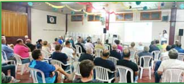
Jornada PAC 6 octubre Peñalba