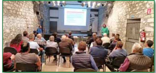
Jornada PAC 4 octubre Castejon de Sos