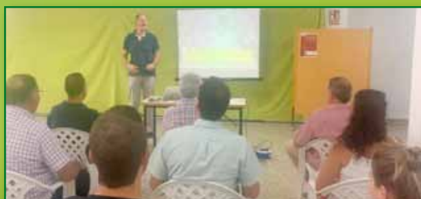
Jornada de Almendro ecologico en Huesca