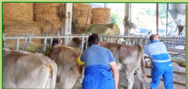
Curso Inseminación Vaca Nodriz Ainsa Septiembre 2