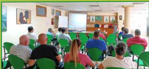
Curso de porcino en Fraga