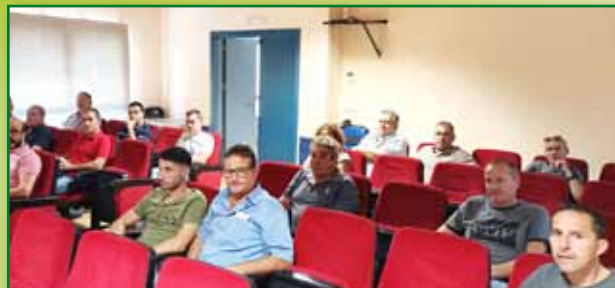
Curso de porcino en Sariñena