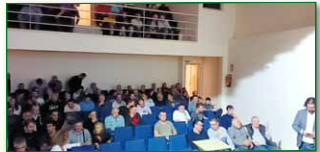
Jornada PAC 13 octubre Graus