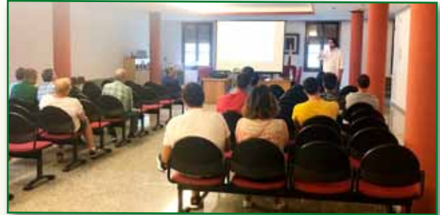
Jornada PAC 25 agosto Gurrea de Gallego