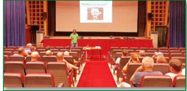
Jornada PAC 15 septiembre Zaidin