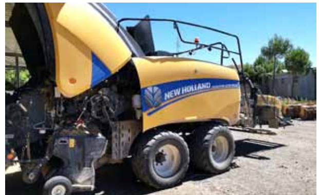
Foto 2. Empacadora preparada para la colocación de sensores de temperatura.