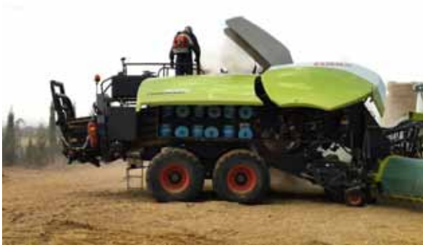
Foto 1. Limpieza del residuo presente en la máquina antes del inicio de la jornada de trabajo.

estudio es que la información aportada por las sondas de temperatura resultó muy interesante para los usuarios de las empacadoras ya que les permitieron monitorizar en tiempo real, a través de la pantalla de datos de las sondas, el correcto funcionamiento de los mecanismos. Por ejemplo, mediante la visualización de los elevados registros en el freno de la horquilla de una de las máquinas (190°C de máxima), por medio de acciones de mantenimiento, fue posible disminuir la temperatura del mecanismo hasta 160 °C de máxima, y disminuir el riesgo de incendio en una de las empacadoras.