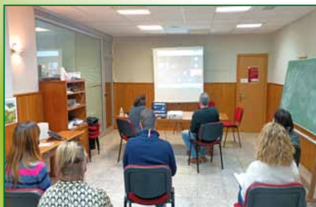
Jornada tecnicos Incorporación de Jovenes en Barbastro