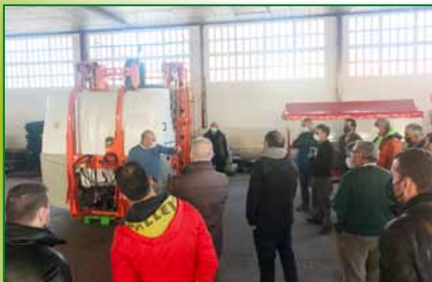
Curso de fitosanitarios basico de Barbastro