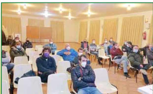
Jornada normativas ganaderas Bernabarre