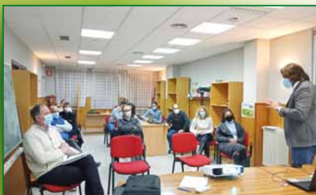
Curso para tecnicos Pac en Barbastro