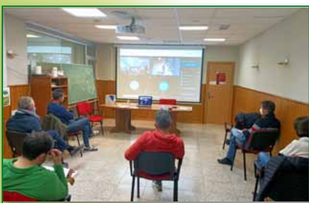
Jornada normativas ganaderas Barbastro