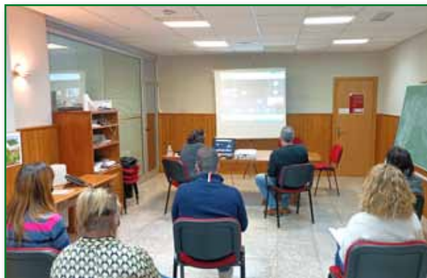
Jornada tecnicos Incorporación de Jovenes