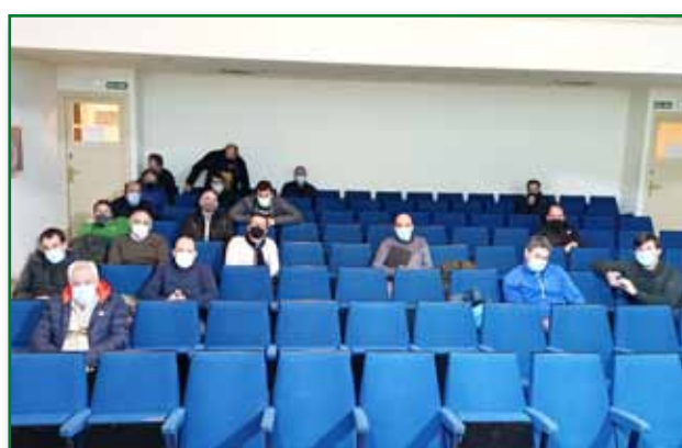
Jornada normativas ganaderas en Graus