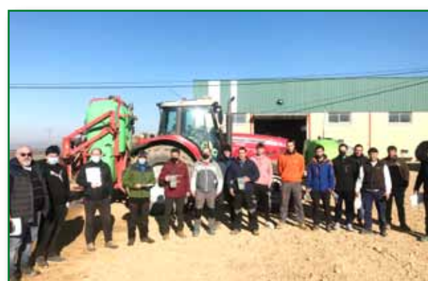
Curso fitosanitarios cualificado Barbastro