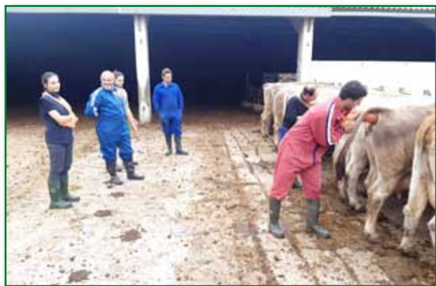
Curso de inseminación de vaca nodriza en Hecho. Mayo