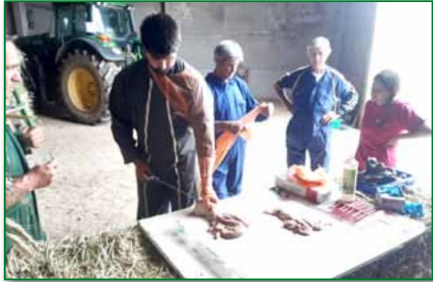
Curso de inseminación de vaca nodriza en Baros. Mayo