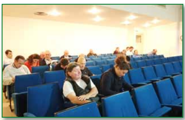
Jornada Poda de almendro en Barbastro