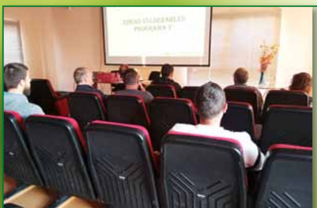
Curso de manejo de porcino en Sariñena. Mayo