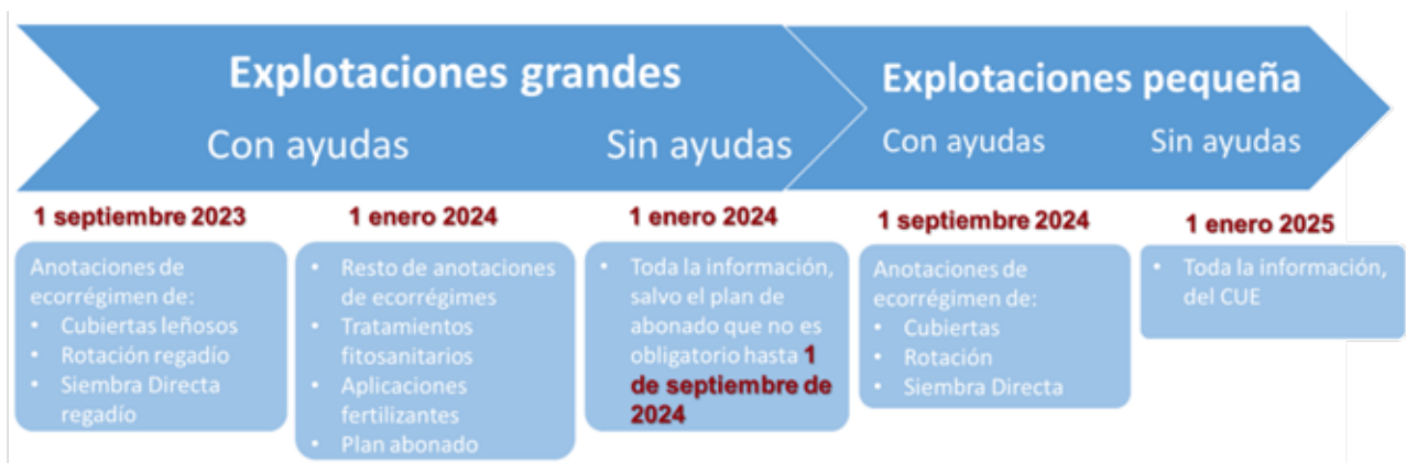
Flujograma de entrada en vigor del Cuaderno Digital

A partir del 1 de enero de 2025, todos los solicitantes deberán rellenar la totalidad de la información del cuaderno digital.