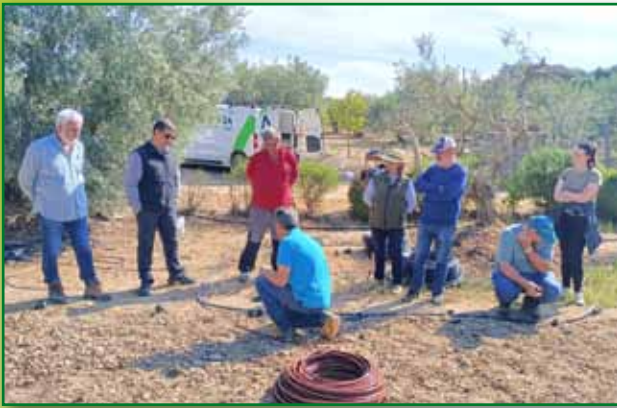
Curso de riego por goteo en Barbastro