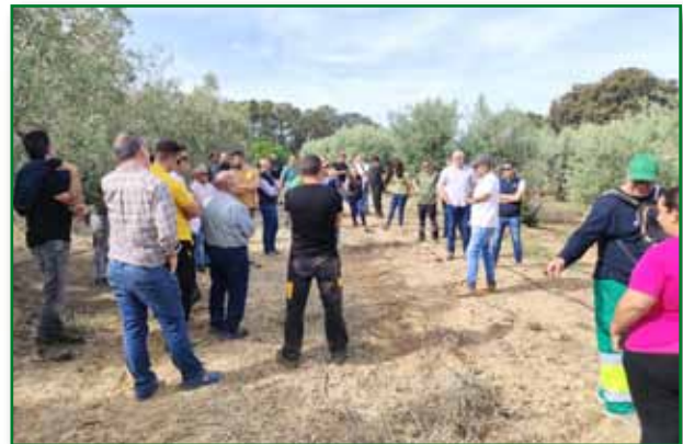
Jornada de triturado restos de poda y ecogestiones Barbastro. Mayo