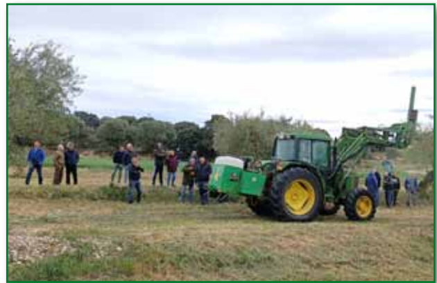
Jornada de poda con discos en olivo abril Loporzano