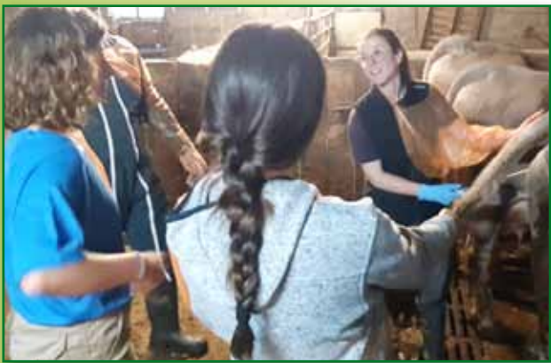
Curso de inseminación de vaca nodriza en Buesa. Mayo