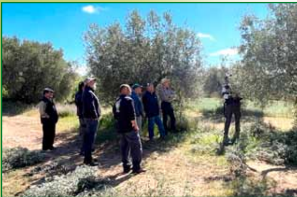
Jornada de poda tradicional en olivo abril Azanuy