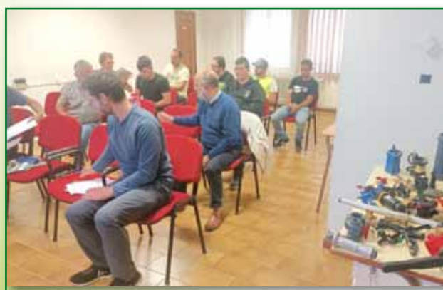
Curso de riego por aspersión en Barbastro. Mayo-junio