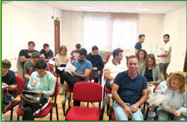
Curso de incorporación a la empresa agraria en Barbastro. Mayo