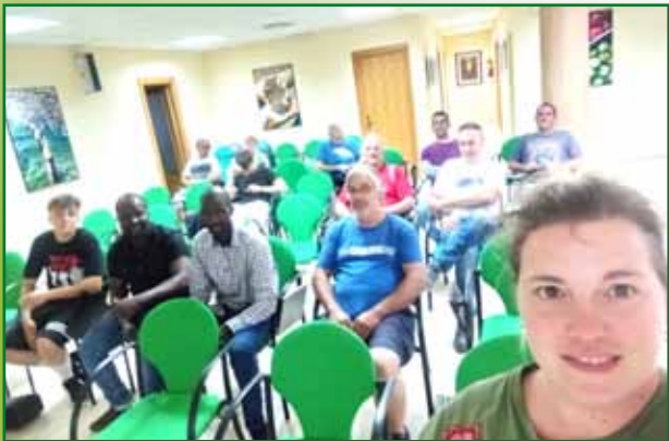
Curso de manejo de porcino en Fraga. Abril